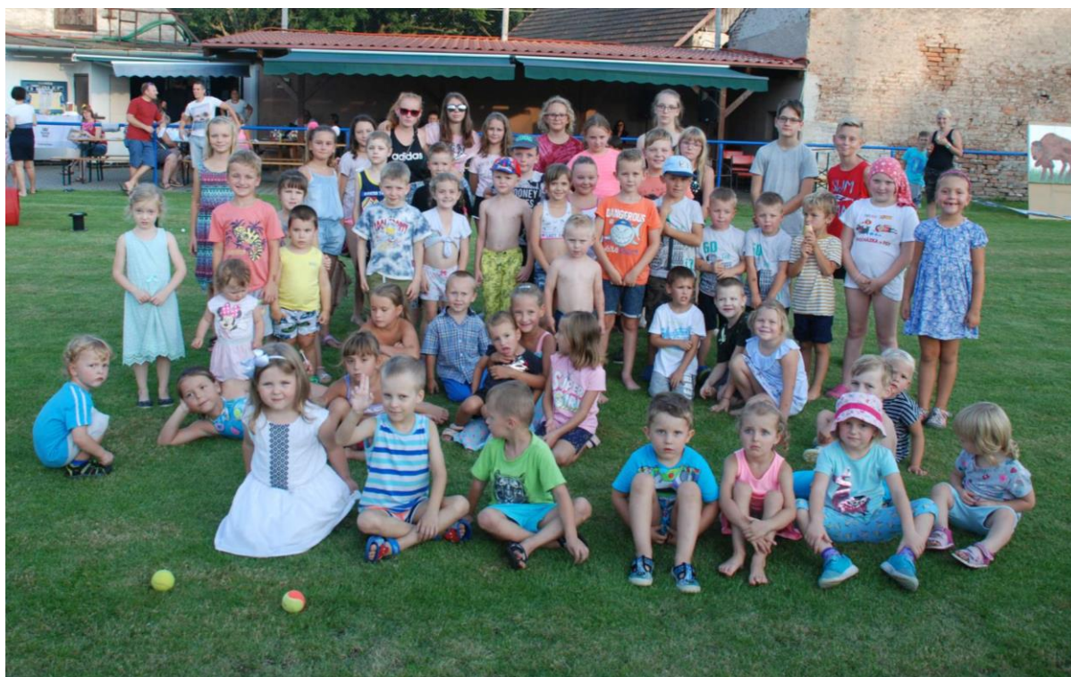
Foto z loňského Loučení s prázdninami

V říjnu plánujeme strašidelný průvod obcí . Na konci roku nás čeká Rozsvícení vánočního stroměčku, Mikulášská nadílka a Vánoční zpívání.