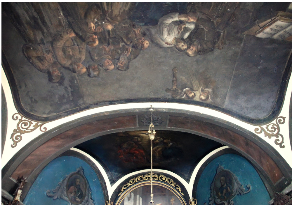
Výmalba klenby kaple. V pozadí (nad oltářem) vyobrazena Nejsvětější Trojice, v popředí smrt sv. Metoděje.

Kaple je zasvěcena slovanským věrozvěstům, svatým Konstantinu – Cyrilu (826/827 – 869) a Metodějovi (815 – 885). V druhé polovině 19. století byli tito světcí v českých zemích velice oblíbení, o čemž svědčí řada patrocinií z této doby. V průčelí kaple se dodnes dochovala deska s nápisem „Svatý Cyrille a Methoději orodujte za nás! K úctě apoštolů slovanských L. P. 1869.“