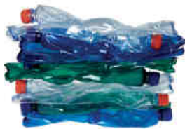
sešlapané PET lahve 10 ks