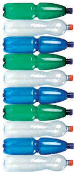
nesešlapané PET lahve 10 ks

3) Uzávěry a etikety se musejí odstranit – NE, při drcení a praní PET materiálu jsou tyto příměsi odstraněny.