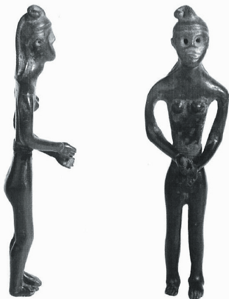
Syrsko-chetitská soška vozatajky z Kouřimi

ovšem nebyl uzavřen pouze do horizontu místa, kde se pohyboval a kde žil, např. osady či vesnice, rovněž (je otázka do jak velké míry) byl spojen i s globálnějším světem – světem obchodu a směny, kde také jistě vznikají i kulturní kontakty a vzájemné ovlivňování představ a názorů o životě, a o světě obecně. Střední Čechy, jak již bylo zmíněno, byly křižovatkou několika pravěkých obchodních stezek - z nálezů ze samotného polepského pohřebiště je toho důkazem elegantní koflík, původem zřejmě z Moravy (viz obr. nahoře).