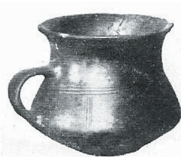
Únětický kotlík z Polep (Dvořák, 1936)

Význačný jest též džbáněček bohatě zdobený jemným tečkováním s bělavou náplní.(viz obr.) Zajímavá jest dále skupina misek na nožce a baňatých džbáněčků, z nichž některé jsou tak podobné nádobkám z posledních zvoncových hrobů, že z nich můžeme snadno vyčísti, z jakého pravzoru se vyvinula nejstarší únětická keramika.“ (Dvořák, 1936, s.42). Zajímavá nádoba s bělavým tečkováním (tzv. inkrustací - vpichováním barviva do vyrytých ornamentů), o které Dvořák píše, by mohla být onou výjimkou cizí provenience, v tomto případě moravské (Moucha, 1954). Lze těžko rekonstruovat, jak se do polepské oblasti tato nádoba dostala: přímo v rámci obchodních styků jako kvalitní a „krásné“ zboží, či jako obal nám neznámého obsahu, nebo si ji prostě někdo mohl přivést.